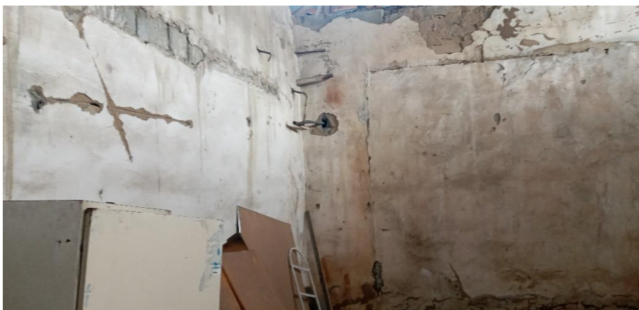
Фото: Свободные помещения в здании джамоата М.Ширинджонов, в которых будут созданы классы после реконструкции для ЦОМ.

Также строительство туалета на 4 очка и благоустройство территории перед отдельным входом в ЦОМ.