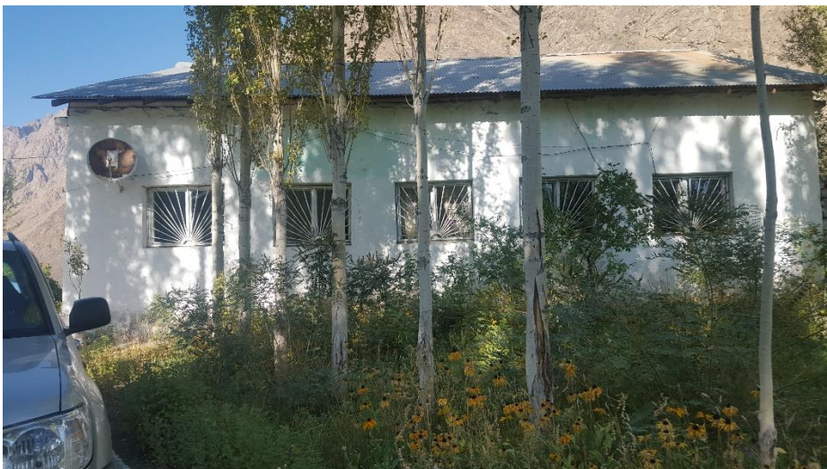
Фото: Здание джамоата М.Ширинджонов (бывшее административное здание «Птицефабрики»)

Физическое описание: Здание сельского джамоата М.Ширинджонов было построено в 1980 году для административного здания «Птицефабрики». В начале 90-х годов прошлого века после распада Советского союза «Птицефабрика» из-за экономического кризиса перестала функционировать и в конечном итоге обанкротилась. В связи с этим, в 1995 году административное здание «Птицефабрики» по решению Хукумата района Шугнан было передано на баланс джамоата Ширинджонов для постоянного использования.