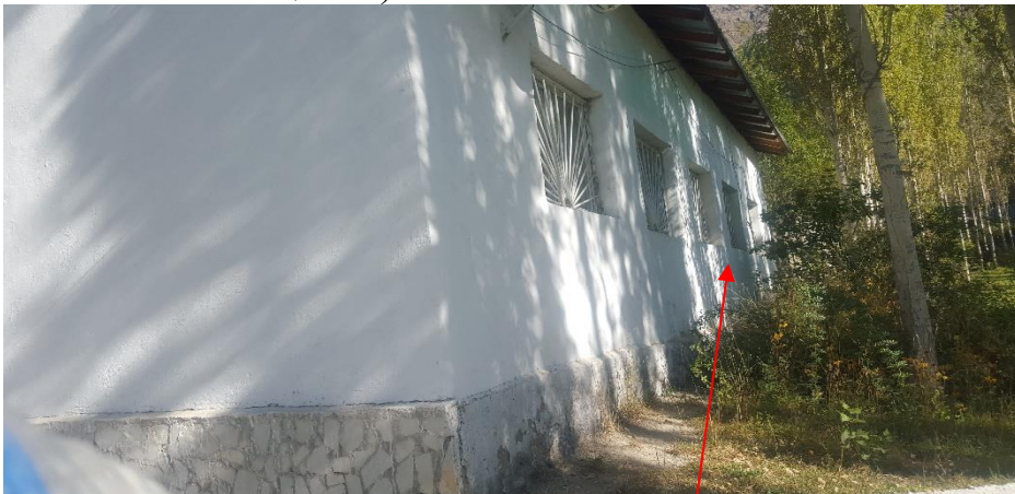
Фото: Здание джамоата М.Ширинджонов, запланированный вход в центр обучения молодёжи (ЦОМ)

Однако, для создания «Центра обучения молодёжи» (ЦОМ) в здании джамоата М.Ширинджонов необходима реконструкция неиспользованных помещений под требуемые помещения ЦОМ (необходимо создание 3 классных помещений).