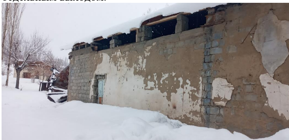
Фото: Вид сзади здания джамоата М.Ширинджонов

В связи с этим, в рамках реализации подпроекта SERSP-1С-14 по созданию центра обучения молодежи предусмотрено проведение реконструкции и капитального ремонта внутри здания общей площадью 175 м 2 , которое состоит из 3 классных помещений (142 м 2 ) и вспомогательных помещений (33 м 2 ). Капитальный ремонт и реконструкция предусмотрены в части здания, т.е. в 3 классных помещениях и коридоре с отдельным выходом.