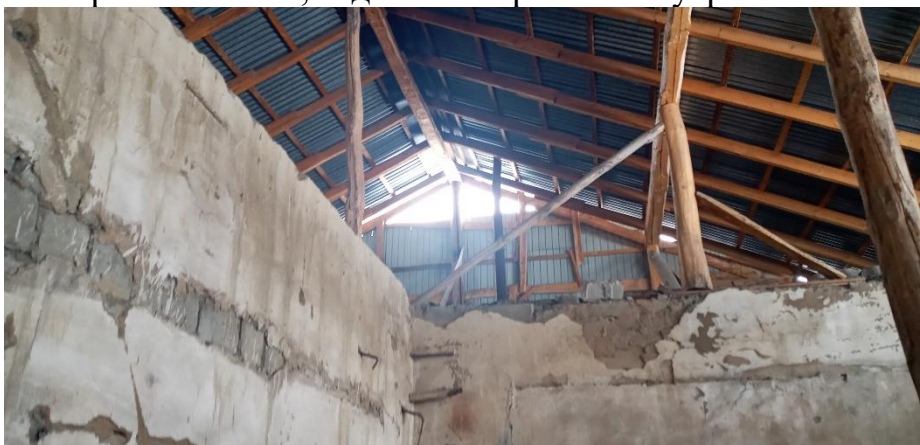
Фото: Свободные помещения в здании джамоата М.Ширинджонов, в которых будут созданы классы после реконструкции для ЦОМ.

ремонтные работы по замене оконных и дверных блоков, потолков и полов, системы внутреннего электроснабжения, отделочные работы внутренних стен.