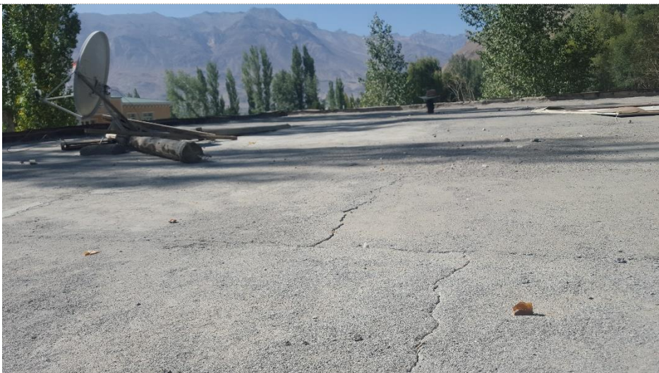
Фото: Аварийное состояние кровли здания ТГЗ

Особенно на протяжении многих последних лет существующая мягкая кровля (битумная кровля) здания стало непригодной и в период дождевых и снеговых осадков вода проникает внутрь здания, такая ситуация может привести здание к аварийному состоянию.