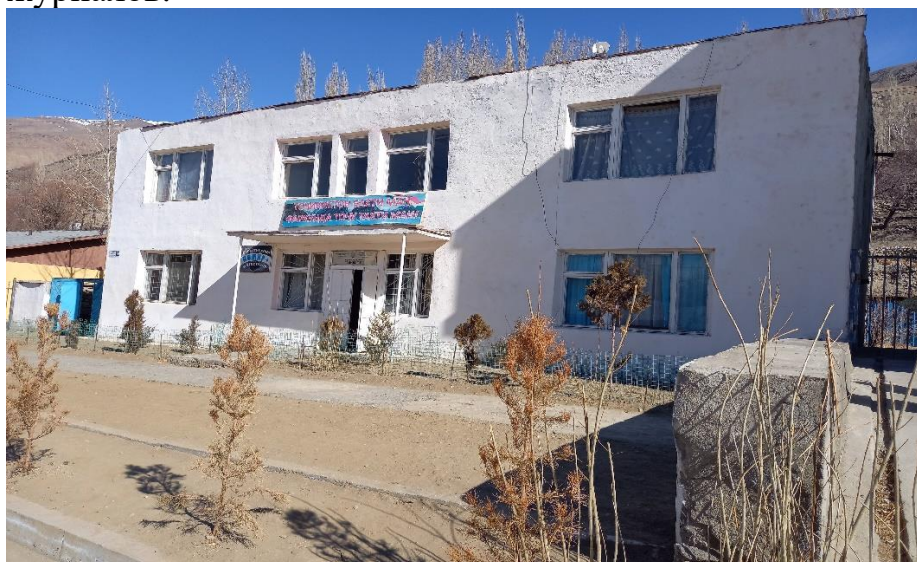
Фото: Здание центра типографии газеты “Зиндаги”

Физическое описание: Здание типографии газеты “Зиндаги” было построено в 1989 году со стороны Хукумата района Ишкашим именно для выпуска газет и журналов.