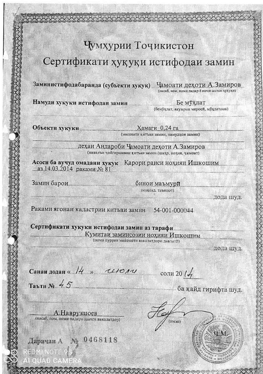
План землепользования сельского джамоата А. Замиров в селе Андароб