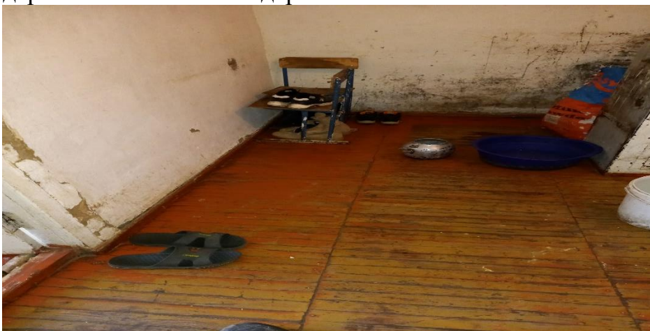
Фото: Внутренние помещения здание сельского джамоата

Данное здание было построено капитально по тем меркам 90- годов прошлого века, то есть фундамент железобетонный, стены выполнены из цементных блоков, перекрытия этажей из железобетонных пустотных плит, полы деревянные, оконные и деревянные блоки стандартные.