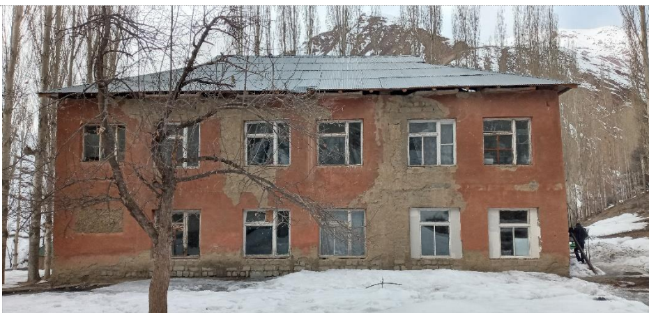
Фото: Здание сельского джамоата А.Замиров

Данное здание было построено капитально по тем меркам 90- годов прошлого века, то есть фундамент железобетонный, стены выполнены из цементных блоков, перекрытия этажей из железобетонных пустотных плит, полы деревянные, оконные и деревянные блоки стандартные.