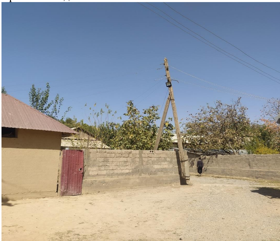
Фото: Состояние опра

Запланированные мероприятия будет производится на основе составленного дефектного акта о состоянии старые опоры села Бурка и разработанных чертежей по восстановлению линия электроснабжения со стороны инженеров НСИФТ-а, и согласования Барки точик района Пяндж.