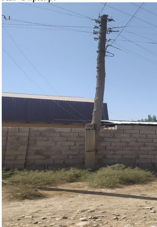
Фото: Состояние опора

Запланированные мероприятия будут производиться на основе составленного дефектного акта о состоянии старых опор села Бустон и разработанных чертежей по восстановлению линии электроснабжения со стороны инженеров НСИФТ-а, и согласования Барки точик района Фархар.