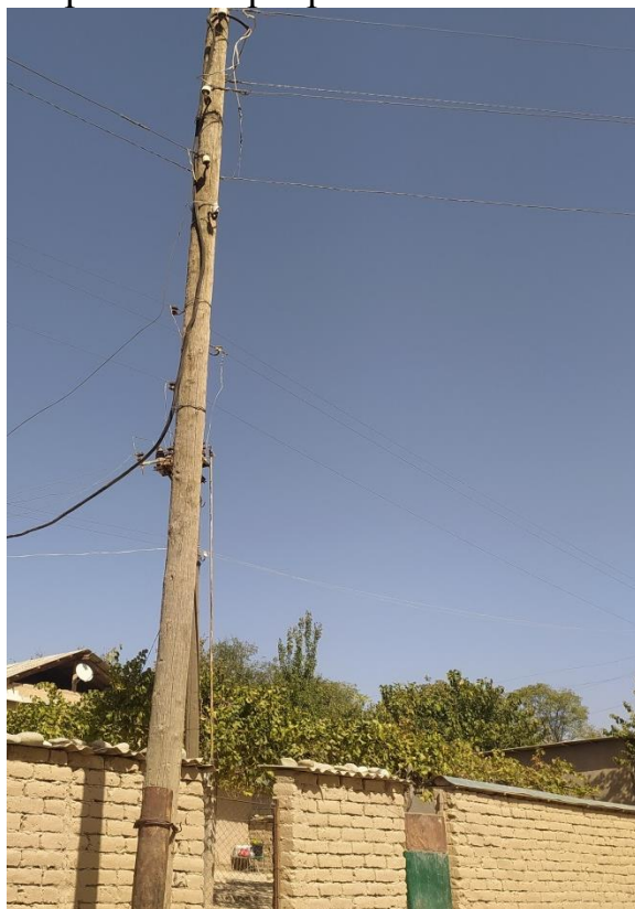
Фото: Состояние опра

Запланированные мероприятия будут производиться на основе составленного дефектного акта о состоянии старых опоры села Давлатобод и разработанных чертежей по восстановлению линии электроснабжения со стороны инженеров НСИФТ-а, и согласования Барки точик района Фархар.