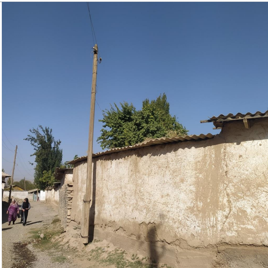
Фото: Состояние опоры

Продолжительность восстановительных системы электроснабжения работ по подпроекту SERSP-1A-30 составит около 1-месяцев и гарантийный срок после ввода объекта в эксплуатацию составит 1 (один) год.