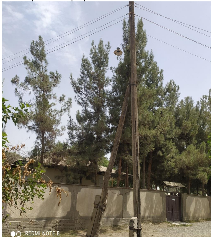
Фото: Состояние опра

Запланированные мероприятия будут производиться на основе составленного дефектного акта о состоянии старых опоры села Сайёра и разработанных чертежей по восстановлению линии электроснабжения со стороны инженеров НСИФТ-а, и согласования Барки точек района Фархар.