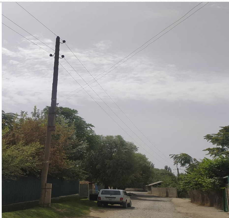
Фото: Состояние опра

Продолжительность восстановительных системы электроснабжения работ по подпроекту SERSP-1A-38 составит около 1,5-месяцев и гарантийный срок после ввода объекта в эксплуатацию составит 1 (один) год.